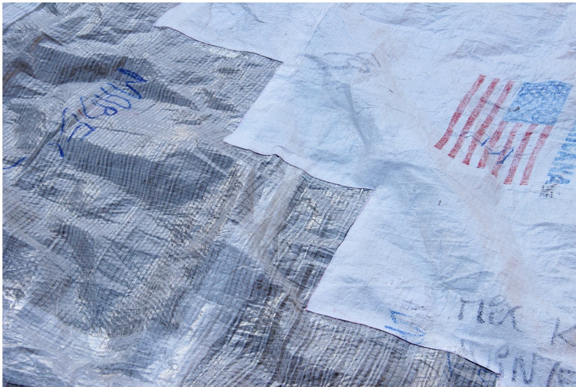
Espejo , 2019. Patchwork en arpillera sintética. 280 x 350 cm (detalle)