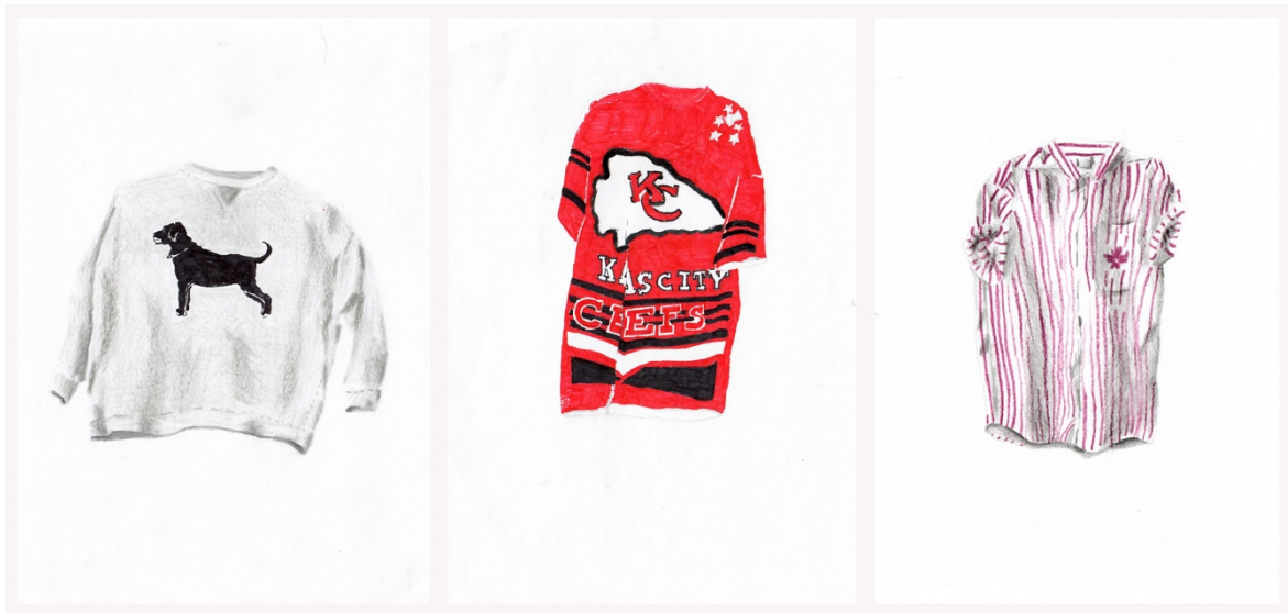
Prendas, 2016-2019. Lápiz sobre papel. 21 x 15 cm c/u