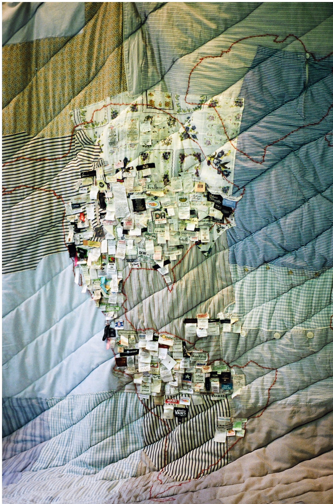
Mantamundi , 2016. Patchwork de ropa, etiquetas y bordados. 210 x 360 cm (detalle)